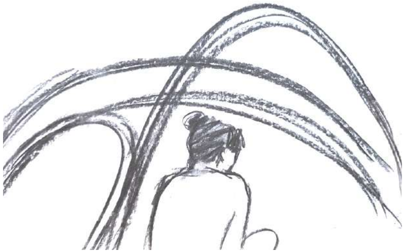
Il·lustracions: Bea González